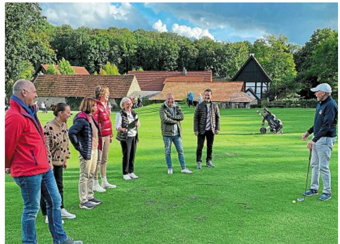
Der Bürgerverein „Offensive“ führte sein Vereinsfest mit Familien, Freunden und Gästen unter toller Beteiligung in den Anlagen des Golfclubs Tecklenburger Land durch, wo auch die Möglichkeit zum Schnuppergolf genutzt wurde.

Anzeigenleitung: WN-Anzeigenleitung: Marc Arne Schümann. ZGM/ZGW-Anzeigenleitung: Thomas Ries. Anschritt für beide: Aschendorff Medien GmbH & Co. KG, An der Hansalinie 1, 48163 Münster, Telefon (02 51) 6 90-0, Fax (02 51) 6 90-80 85 90, E-Mail: anzeigen@zgm-muensterland.de, Homepage: www.zgm-muensterland.de. Mitglied der ZGW Zeitungs-Gruppe Westfalen. Es gelten die Mediadata gültig ab 1.7.2024. Leitung Lesermarkt: Sascha Krollmann. Anschritt: Aschendorff Medien GmbH & Co. KG, An der Hansalinie 1, 48163 Münster, Telefon (02 51) 6 90-0, Telefax (02 51) 6 90-45 70, E-Mail: kundenservice@wn.de. Zustellung/Logistik: Aschendorff Logistik GmbH & Co. KG, An der Hansalinie 1, 48163 Münster, Telefon (02 51) 6 90-0. Druck: Aschendorff Druckzentrum GmbH & Co. KG, Telefon (02 51) 6 90-0, E-Mail: druckhaus.leitung@aschendorff.de, Anschrift: An der Hansalinie 1, 48163 Münster. Mitglied im International Newspaper Color Quality Club IFRA. Zertifiziert nach ISO 12647-3. Homepage: www.aschendorff.de. Einmal wöchentlich mit TV-Beilage Prisma. Bei Nichtbelieferung ohne Verschulden des Verlages oder in Fällen höherer Gewalt bzw. Streik oder Aussperrung kein Entschädigungsanspruch. Bei unverlangt eingesandten Manuskripten besteht keine Gewähr für Rücksendung. Bezugsunterbrechungen werden ab dem 7. Erscheinungstag vom Verlag vergütet. Für die Herstellung der Westfälischen Nachrichten wird Recycling-Papier verwendet.