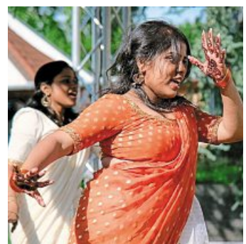
Mitarbeiterinnen aus Indien zeigten für ihre Heimat typische Tänze.

Auf den Bänken im Innenhof saßen die Senioren mit ihren Angehörigen und genossen das abwechslungsreiche Bühnenprogramm. Auszubildende aus Indien und Vietnam nahmen die Besucher mit auf eine musikalische und tänzerische Reise in ihre Heimat. Geleitet in Saris und traditionelle Gewänder, bewegten sie sich mal elegant und dann sehr dynamisch zum Klang der Musik. Auch die Auszubildenden aus dem deutschen Pavillon überraschten die Besucher und Gäste in märchenhaften Kostümen und gaben Brüder Grimms Märchenlesestunde auf der Bühne.