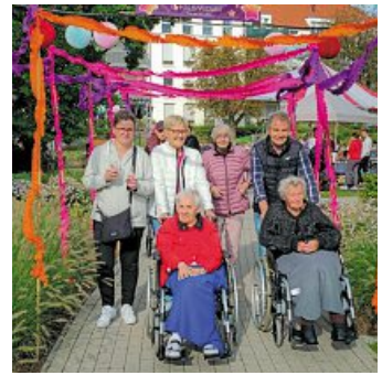
Zahlreiche Girlanden waren Teil der aufwendigen Deko.

LENGERICH. Unter dem Motto „Synergie“ ist im neu gestalteten Garten von Haus Widum ein großes „Festival der Kulturen“ gefeiert worden. Das Gelände strahlte dank einer mit viel Liebe zum Detail gestalteten bunten Dekoration in vielen bunten Farben. Das machte den Tag auch optisch zu einem besonderen Highlight.